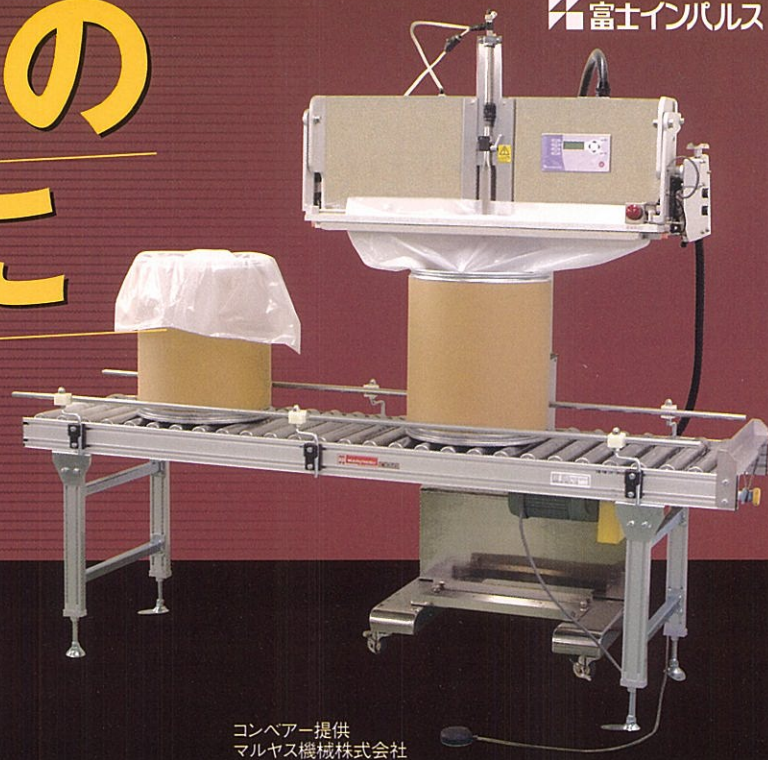
コンベアー提供 マルヤス機械株式会社

近年の産業資材関連の包装事情は、包装内容物の酸化防止をはじめとする商品価値・寿命のUPを目的として「機能性包装資材の活用や真空包装やガス充填包装」へのシフトが進み、“包装作業の省力化・効率化”“コストダウン”“作業環境の快適化”と言う相乗効果を図ることが期待されています。